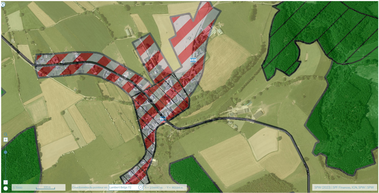
Introduction au plan de secteur. – Extrait du géoportail de la Wallonie walonmap