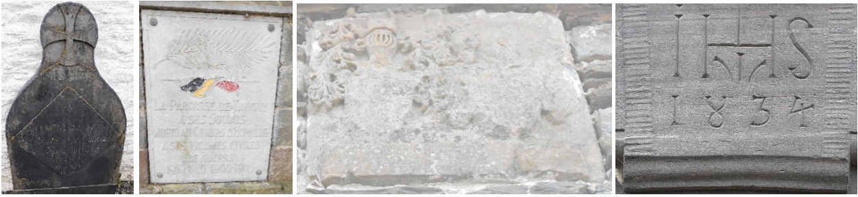
Les vieilles pierres ont des choses à nous dire. Observation du bâti et des monuments.