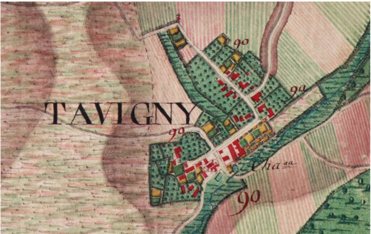
Observation de l'évolution du village à partir de cartes anciennes (extrait carte Ferraris 1777).